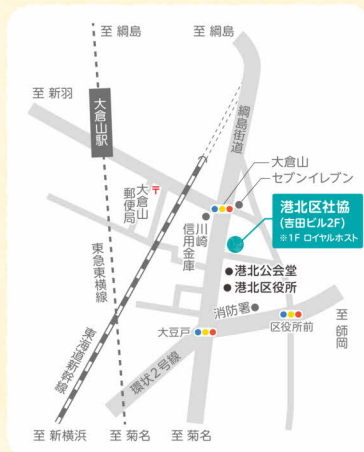
港北区社協 アクセス