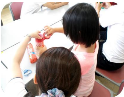
・工作(空気砲づくり)