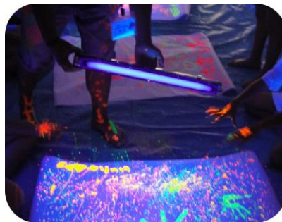
・室内レク(ブラックライト遊び)