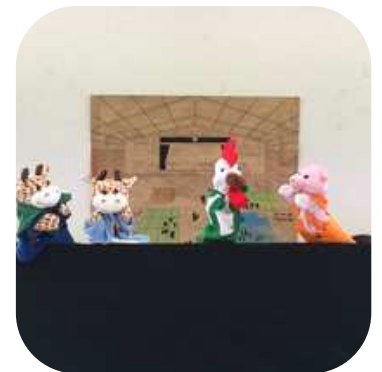
言葉で伝わらないニワトリさんのお話 (人形劇より)

港北区社会福祉協議会 3階 多目的研修室 (港北区役所のお隣のレストランのある建物です)