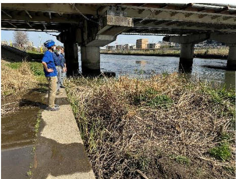
大綱橋とバリケン島