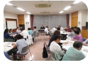
障がい児者に対する理解を深めるための勉強会