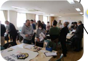
顔の見える関係づくり「つながるプロジェクト」