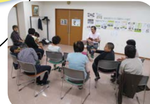
ごとの居場所のーっしろまよ地区放課後プラザ

「ひっとプラン港北*1」の基本理念 *1 「ひっとプラン港北」は、港北区地域福祉保健計画の愛称