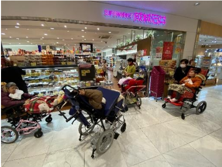
クリスマスのスイーツを買って帰る！ と買い物を楽しんでいらっしゃいました。

今年もクリスマスシーズンがやってきました。街は大きなツリーやきれいなリースでいっぱいです。今回は新横浜プリンスペペ、ホテルエントランスにあるツリーのご紹介です。ここはフラットなので車いす、バギーのまま近くまでいくことができます。帰りにお買物も楽しめます。(写真は2019年、ガイドボランティアさんたちと)